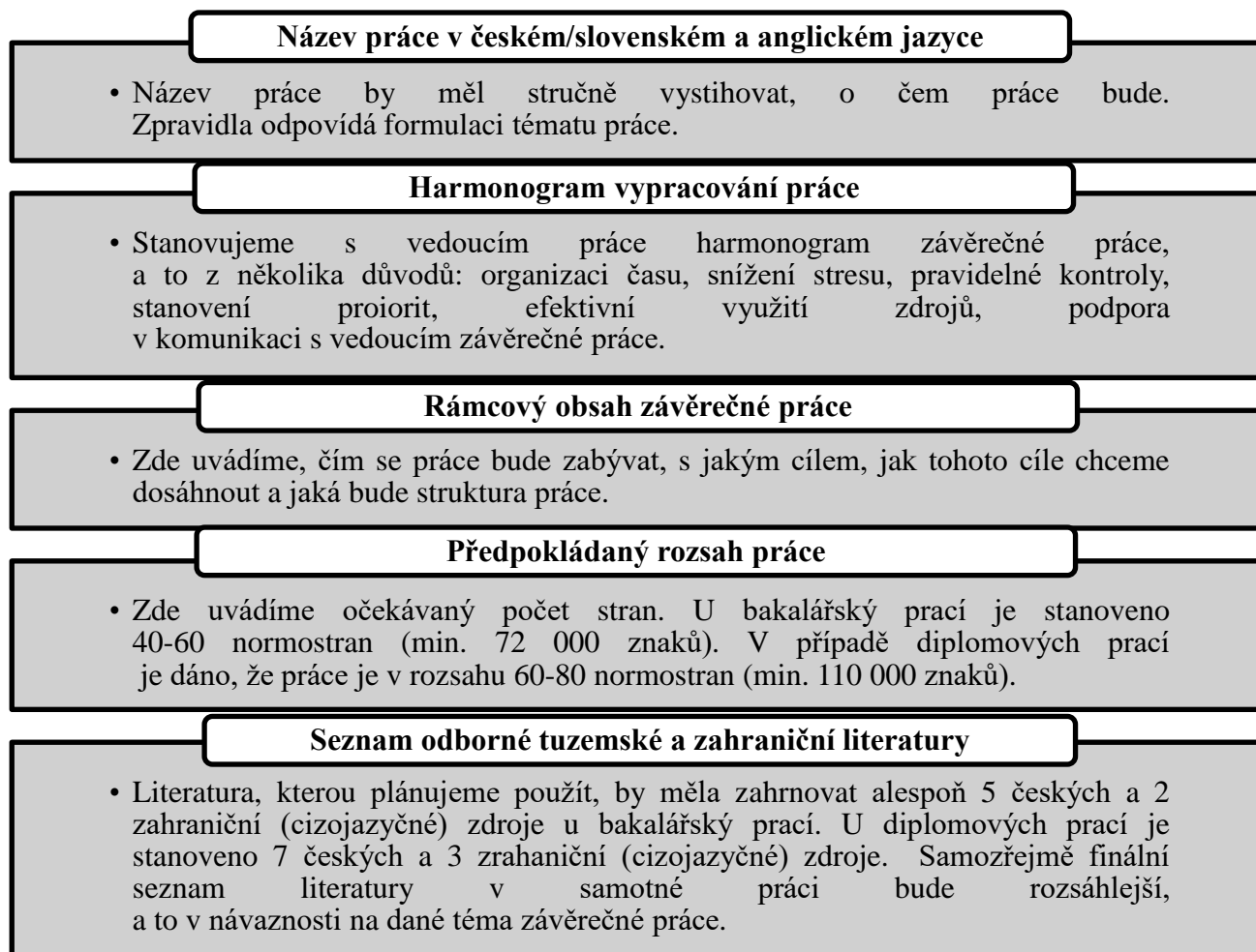
Obrázek 1 Struktura zadání závěrečné práce

Každé zadání závěrečné práce má 5 základních náležitostí, které blíže představuje následující schéma (Obrázek 1).