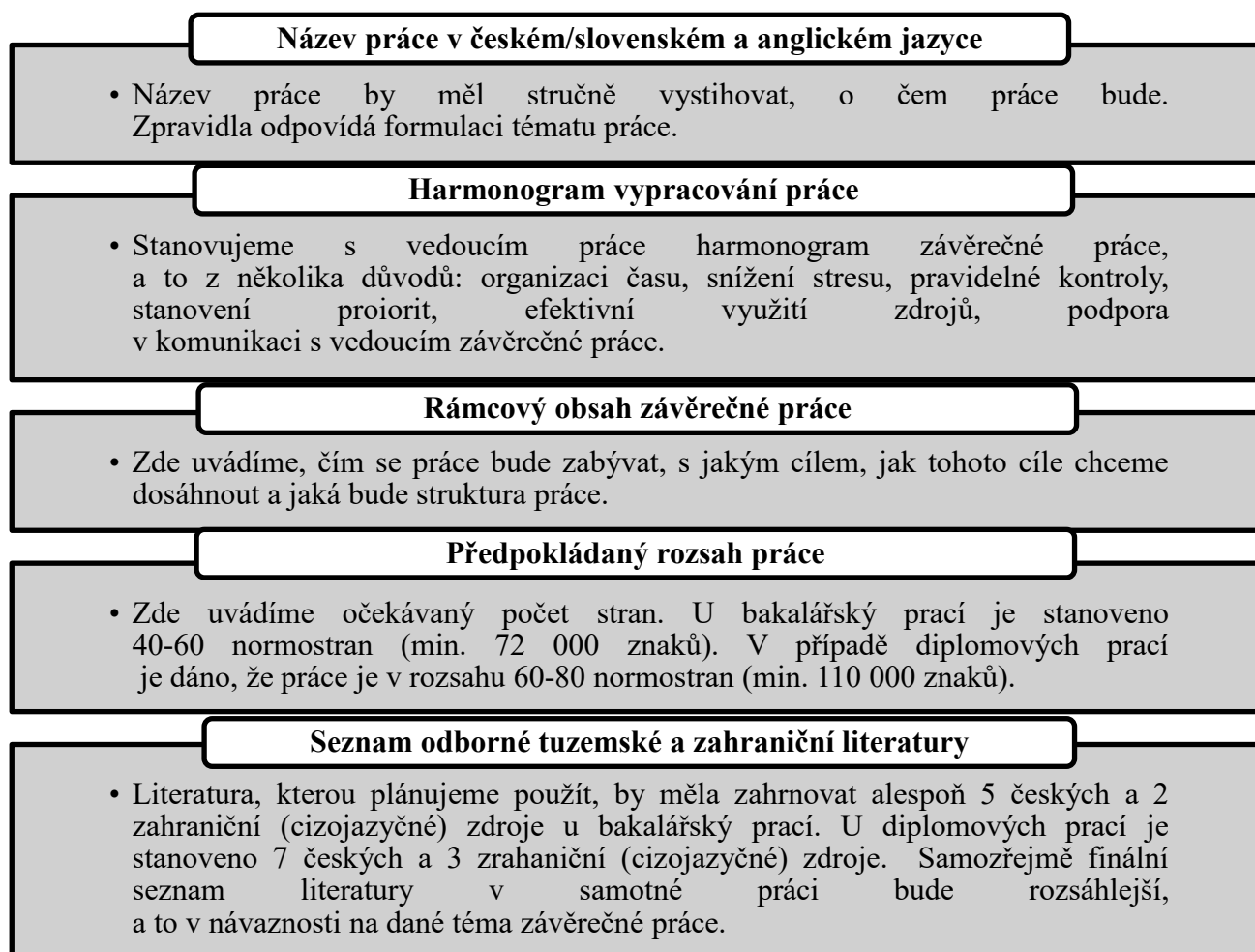
Obrázek 1 Struktura zadání závěrečné práce

Každé zadání závěrečné práce má 5 základních náležitostí, které blíže představuje následující schéma (Obrázek 1).